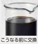
こうなる前に交換!