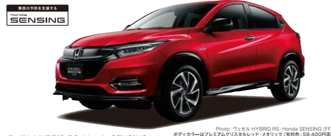
Photo: VEZEL HYBRID RS・Honda SENSING (FF) ボディカラーはプレミアムクリスタルレッド・メタリック (有料色:59,400円高) VEZEL HYBRID RS・Honda SENSING 車本体価格(消費税8%込み) 2,810,000円 ※型式:DAA-RU3 1.5L i-VTEC i-DCC 7速デュアルクラッチトランスミッション+パドルシフト車/FF 車検の予約も承ります

【Honda SENSINGについて】 ■各機能の能力には限界があります。各機能の能力を過信せず、つねに周囲の状況に気をつけ、安全運転をお願いします。各システムは、いずれも道路状況、天候状況によっては、作動しない場合や十分に性能を発揮できない場合があります。Honda SENSINGの機能は車種・タイプにより異なる場合があります。詳しくは営業スタッフまでお問い合わせください。