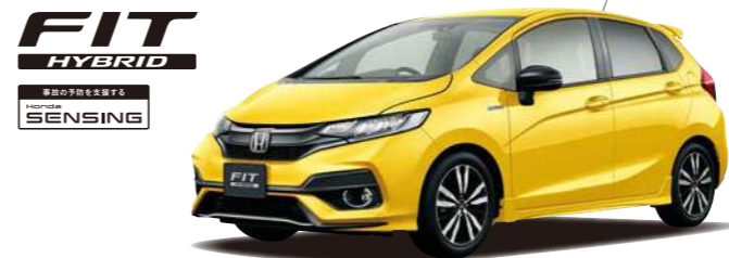
フィット HYBRID・S Honda SENSING Photo: フィット HYBRID・S Honda SENSING (FF) ボディカラーはプレミアムイエロー・パールII (有料色:32,400円高)

型式: DAA-GP5 1.5L i-VTEC e+DCC 7速デュアルクラッチトランスミッション+ハドバルブシフト車/FF *右記価格には写真の有料色の価格は含まれておりません。 車本体価格(消費税8%込み) 2,205,360円