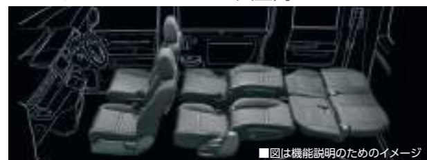
■図は機能説明のためのイメージ