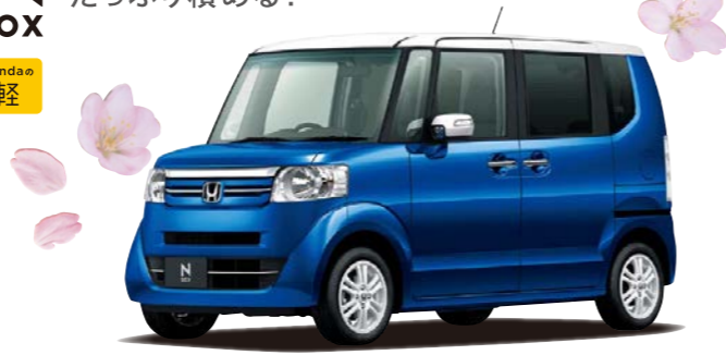
Photo: N-BOX G・ターボLパッケージ(FF) 2トーンカラースタイル(アリアントスポーティブルー・メタリック&ホワイト)

N-BOX G・ターボLパッケージ 2トーンカラースタイル(アリアントスポーティブルー・メタリック&ホワイト) 1,529,400円