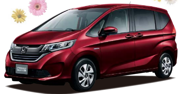
Photo: フリード HYBRID G-Honda SENSING(FF/6人乗り)ボディカラーはプレミアムディープローズパール(有料色:32,400円)

フリード HYBRID G-Honda SENSING(6人乗り) 2,496,000円