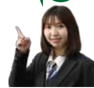
小田原東店スタッフ